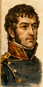
Rafael del Riego