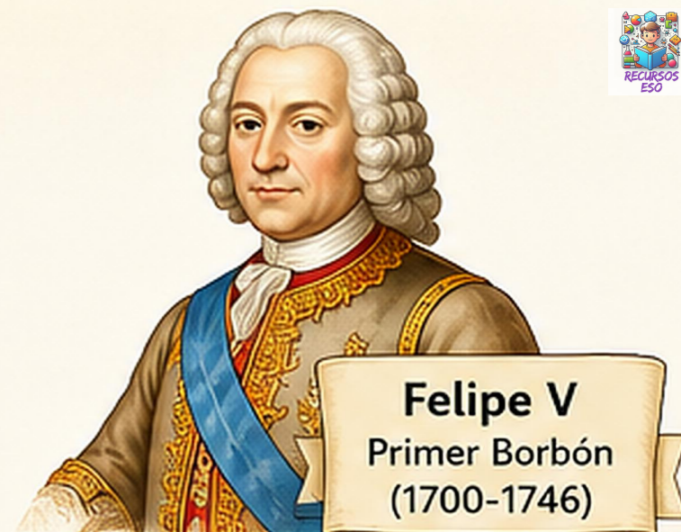
Felipe V Primer Borbón (1700-1746)

Con la llegada de los Borbones al trono en 1700 comienza una nueva dinastía en España. Su objetivo principal fue fortalecer el poder del rey, modernizar el Estado y la economía y convertir a España en una potencia europea .