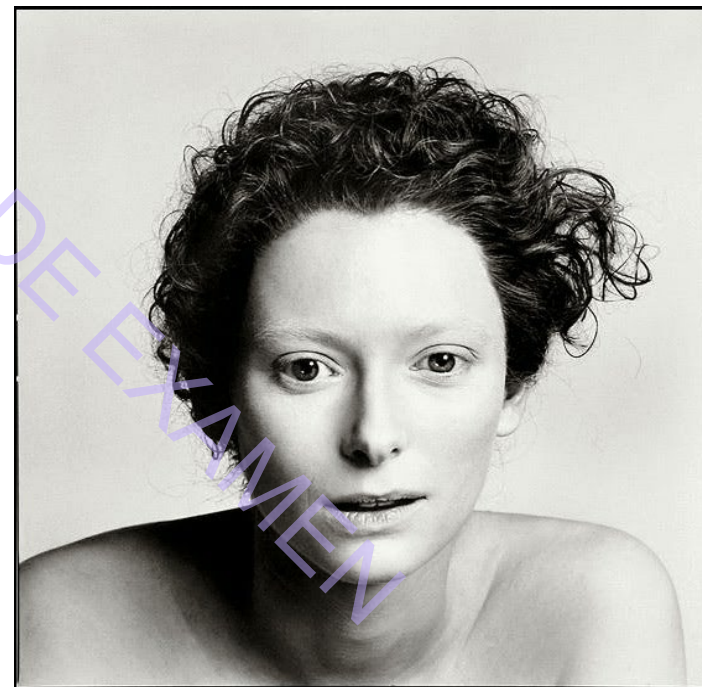
Modelo Opción b)