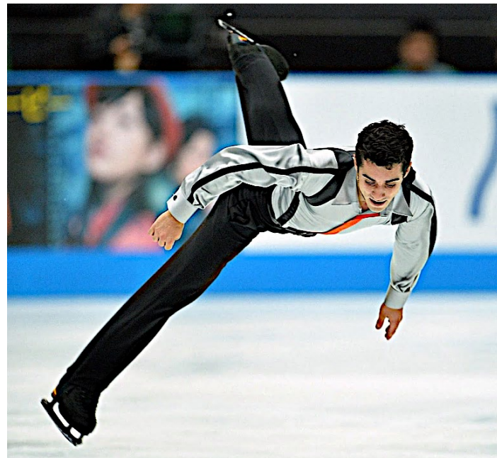
Modelo Opción a)