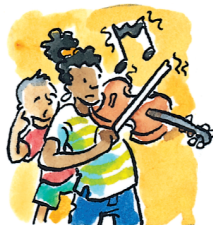
play the violin