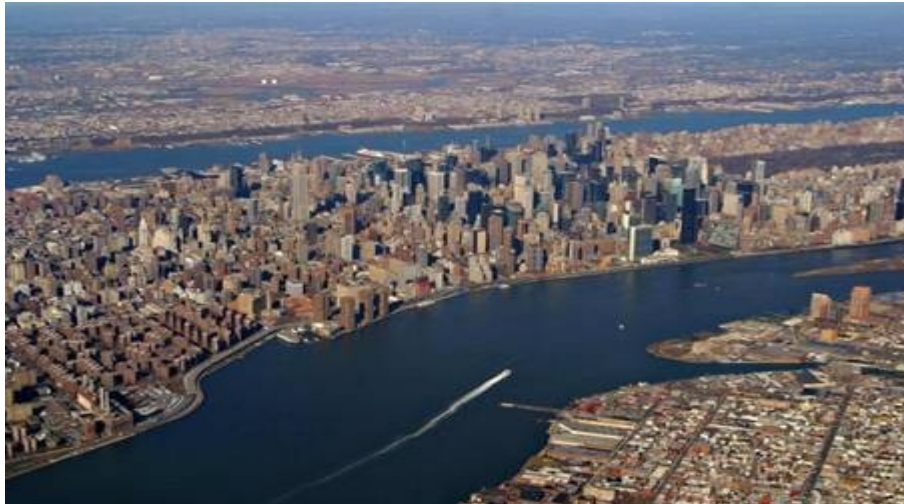
La ciudad de Nueva York

La ciudad es un lugar con edificios y mucha gente.