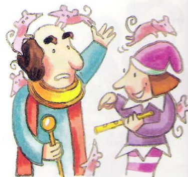
El flautista ofreció sus