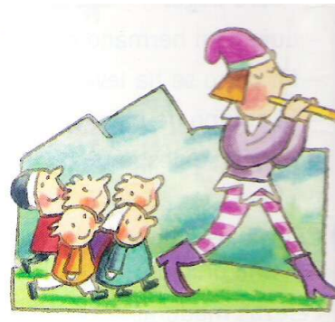
El flautista se marchó