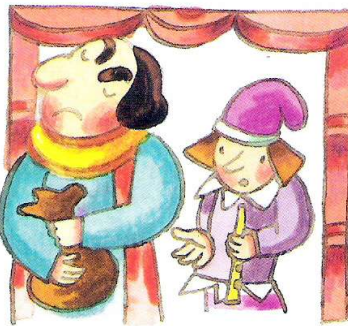
Pero, cuando el flautista