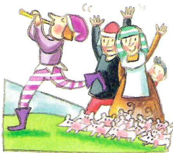
El flautista comenzó a tocar...