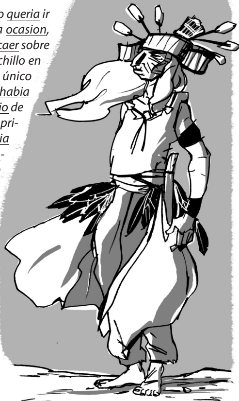
Jordi SIERRA I FABRA El último verano miwok, SM

9 Las palabras subrayadas del texto contienen dip-tongos o hiatos. Coloca la tilde en aquellas que deban llevarla y cópialas a continuación.